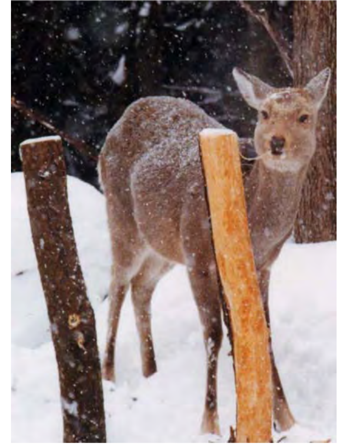
カフェテリア試験地に現れたエゾシカ