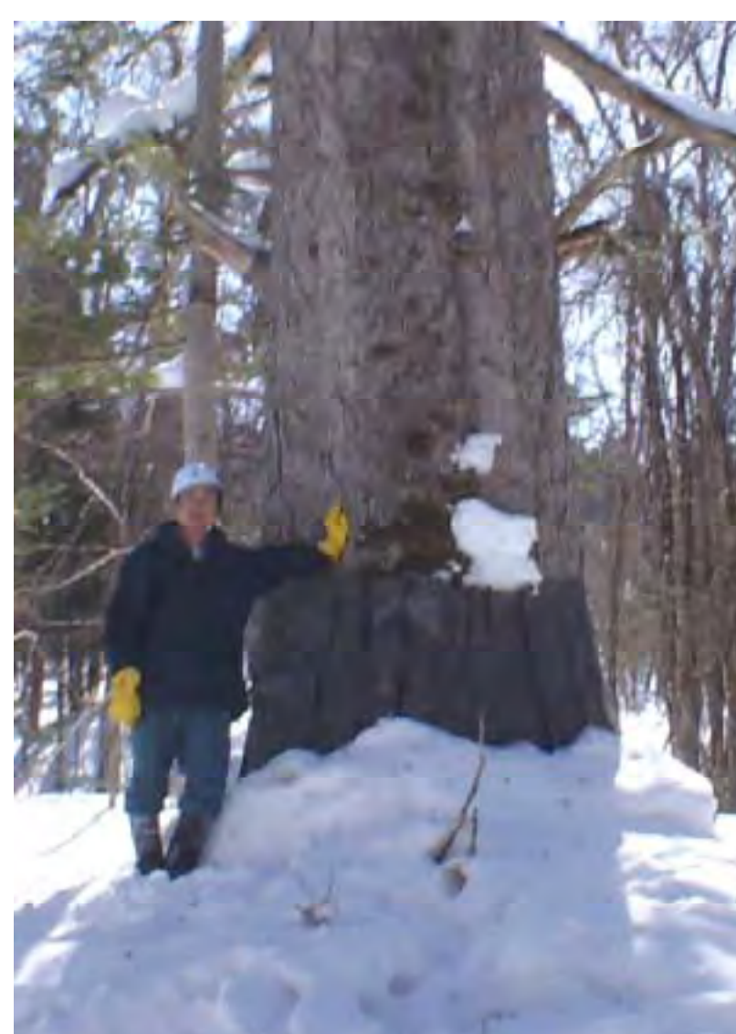
大径木への装着例

左: コントロール 中: 黒ザバーン 右: 白ザバーン コントロールは倒され喰われた。 ザバーンは黒白ともに喰われなかった。