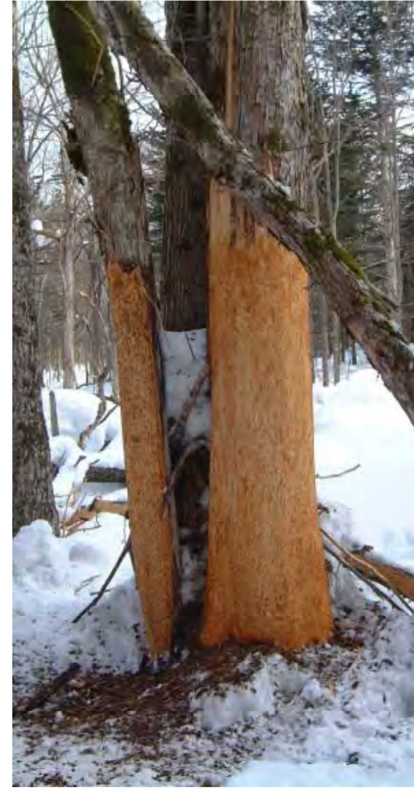
オヒョウ大径木の被害

近年、獣害防除の目的で、造林苗をヘキサチューブ (ハイトカルチャ (株)) というプラスチック製のチューブで覆う技術が実用化され、日本においても100万本の出荷が成されたと聞いている。この様に高く評価されている物理的防除法は、施した個体への防除効果の確実性が高いと思われる。今回試験に用いた不織布 (ザバーン, デュポン (株)) はヘキサチューブ同様に物理的に獣害から樹木を防除するものである。ヘキサチューブは苗の防除には適しているが、1m級の母樹には用い難いと考えられる。ザバーンはポリプロピレンの不織布で、その最大の特徴は大径木にも適用できる柔軟性にある。軽量で作業性が良く、胸高直径が1mにもなるオヒョウなどの大径木にも簡単に巻くことができる。柔軟な素材であるにも関わらず、2.5cm幅でプリーツが付いているために、筒状に留めるだけで自立する。この様な特徴から、林内に適当な配置で母樹を選択的に残す手段としての利用法が考えられる。今回の試験は実際に立木試験に適用するに先立って、演者らがシカの嗜好性試験などに用いているカフェテリア試験により不織布 (ザバーン) のシカ食害防除に対する効果を評価することを目的とした。立木を用いた試験では、シカが来なかったために喰われなかったことと、シカが来たにも関わらず喰われなかったことを区別することが困難である。つまり、「喰われなかった」ことが、「シカが喰おうとしても喰えなかった、あるいは喰わなかった」ことを意味しない。今回用いたカフェテリア試験ではその問題は解決されている。