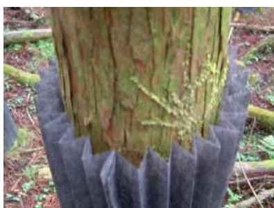
ザバーン製樹皮ガード写真

プリーツ加工をしていますので伸縮性があります。樹木の肥大成長を阻害することなく、長期間剥皮被害を防ぎます。